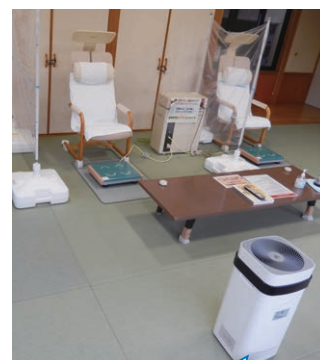
空気清浄機も完備