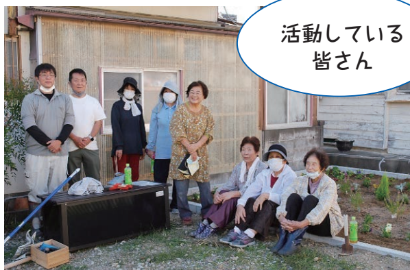
活動している 皆さん