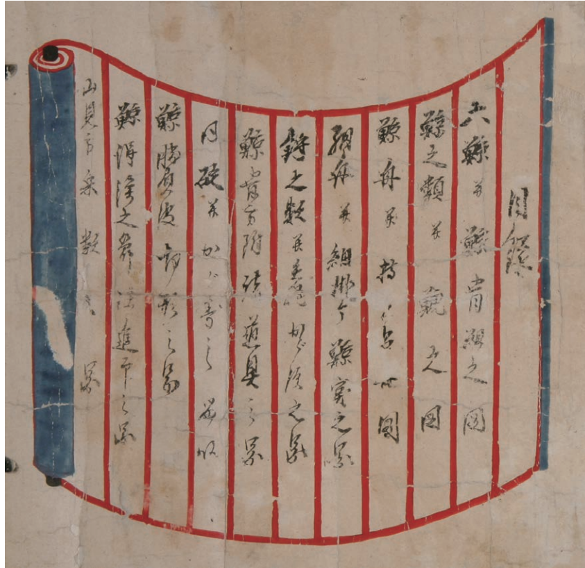
熊野の鯨組は「六鯨」を対象としていた。