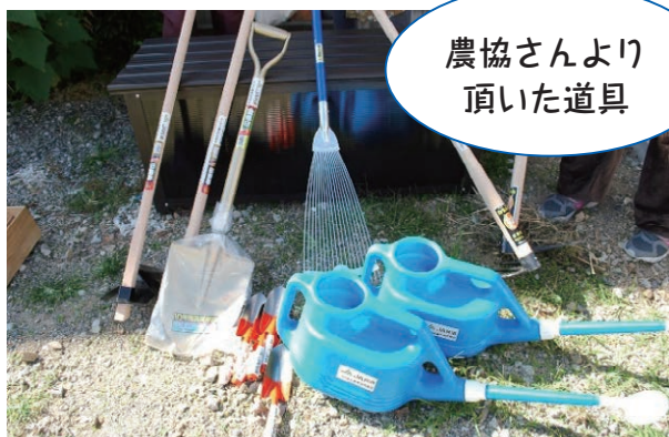
農協さんより 頂いた道具