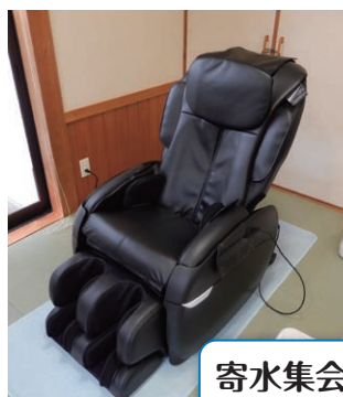
寄水集会所の マッサージ機が新しくなりました！