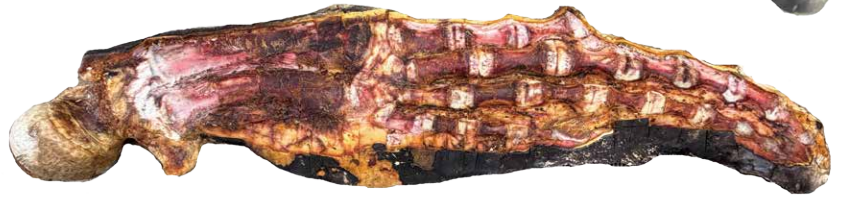
ザトウクジラ胸びれ(右) 上:処理前 下:処理後