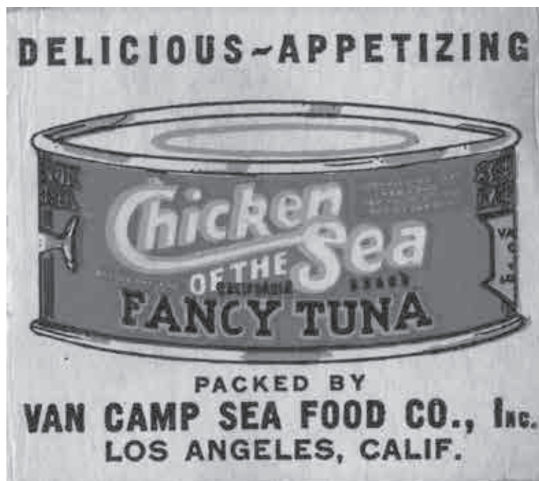
ターミナル島で生産された「チキン・オブ・ザ・シー」の広告

マグロ缶詰をつくるために太地の先人がなぜターミナル島に渡ったのかを考えながら缶詰を手にとると、今やそれらの多くがタイで生産されていること、また勝浦港にマグロの入札を見に行くと、水揚げ作業に汗を流している人々の多くが外国人青年であることが気になります。彼らの多くはインドネシアから来ているそうです。移民の歴史を学ぶことによって、マグロを巡るこうした現状にも関心が広がっていきます。過去の歴史を学ぶことは、現在、そして未来における我々の暮らしを考えることに他なりません。