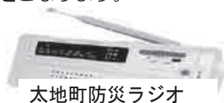
太地町防災ラジオ