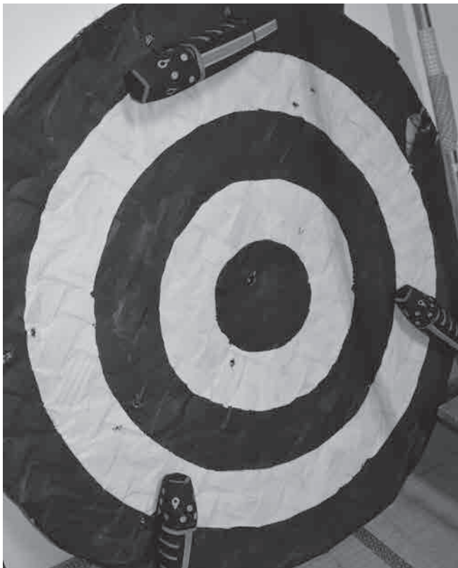
平成29年1月8日、森浦蛭子神社のお弓神事で使われた的。神職に続いて参列者が的を射る。「セミ」は希望者が持ち帰ってお供えする。参列者が引きちぎって持ち帰る的は、これとは別に用意されている。

次号から、太地の近隣で行われている、「セミ」が登場する弓神事を紹介していきます。ところで串本町や新宮市の神社でも弓神事が行われているようですが、的に「セミ」は付いていますか。ご存知の方いらっしゃいましたらお知らせ下さい。