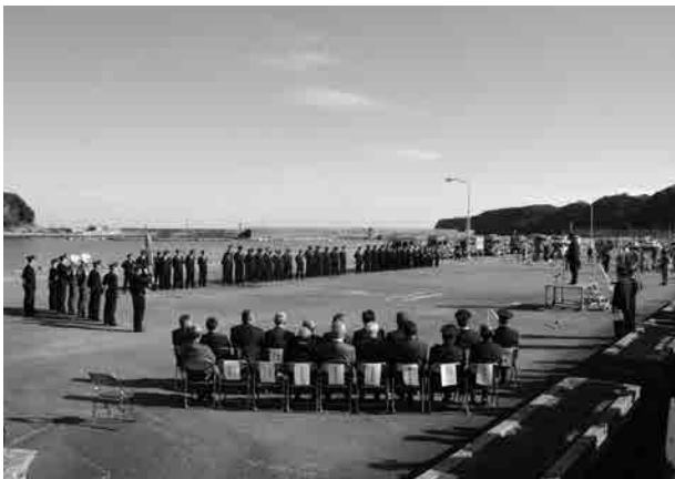
太地漁港ふれあい広場にて式典