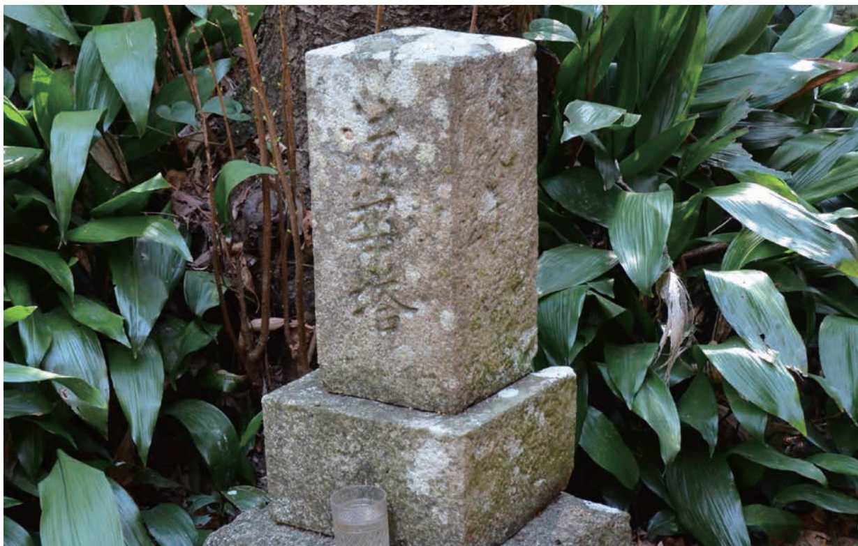
三輪崎の孔島巖島神社にある法華塔(2022年撮影)