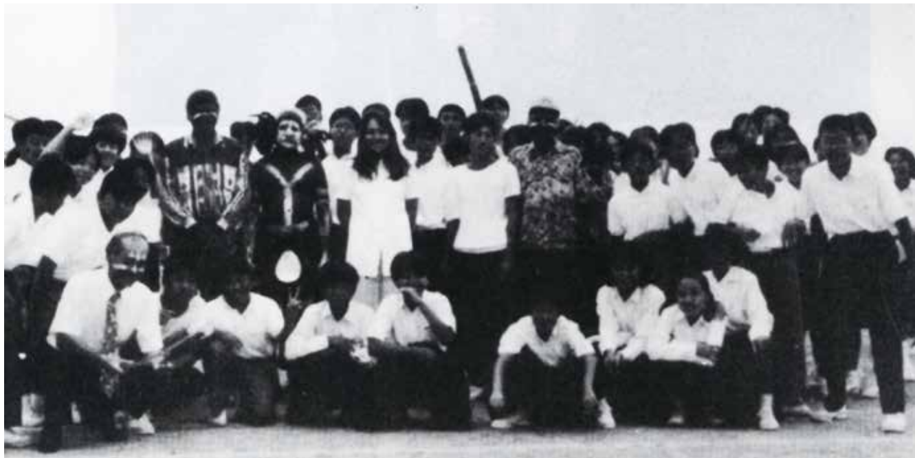
太地中学校における交流の様子